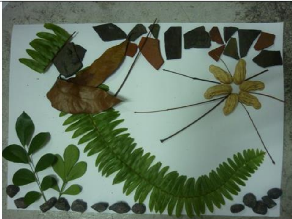
女媧補天拼貼畫〔白底〕