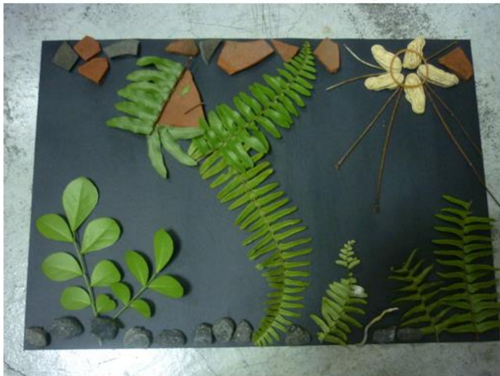
女媧補天拼貼畫〔黑底〕