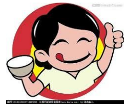
好食 ho \ siid