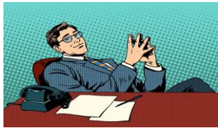
頭家 teu \ ga ✓