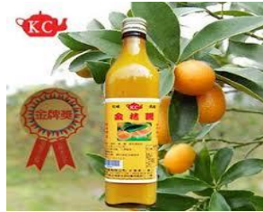
橘醬 gid \ jiong