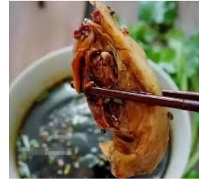
搵豆油 vun teu iu ✓