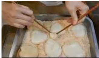
菜粬仔 qi \ ba \ e \