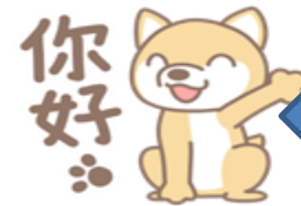
你好 n \ ho \