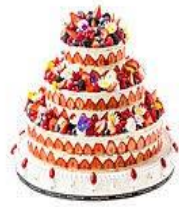
卵糕 lon \ gau ✓