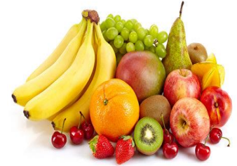
果子 go \ zii \