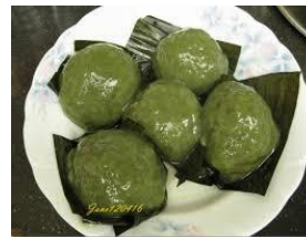
艾粬 ngie ban \